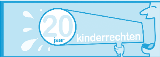
Logo 20 jaar kinderrechten

Het logo '20 jaar kinderrechten' prijkte op duizenden enveloppen en tientallen websites en publicaties van ruim 260 steden en gemeenten, OCMW's en verschillende andere organisaties en instellingen. Allemaal brachten ze de kinderrechten onder de aandacht, omdat die belangrijk zijn, allesbehalve een luxe probleem.