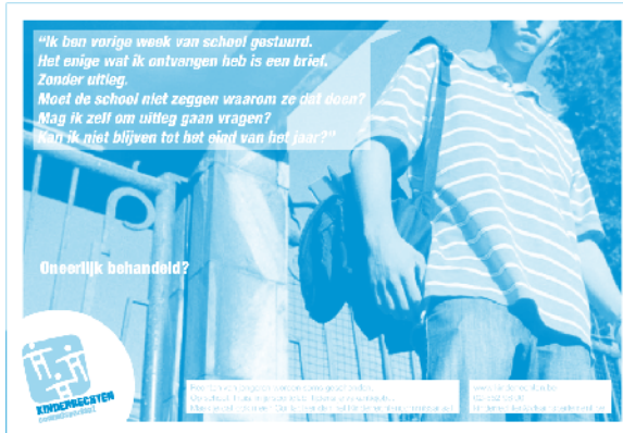
Advertentie Maks! mei 2010

Yeti en Maks! zijn populaire Klasse-bladen voor kinderen en jongeren. Een uitgelezen plek om de ombudsdienst van het Kinderrechtencommissariaat bekend te maken. Dat gebeurt elk jaar in advertenties die telkens een andere probleemsituatie belichten.