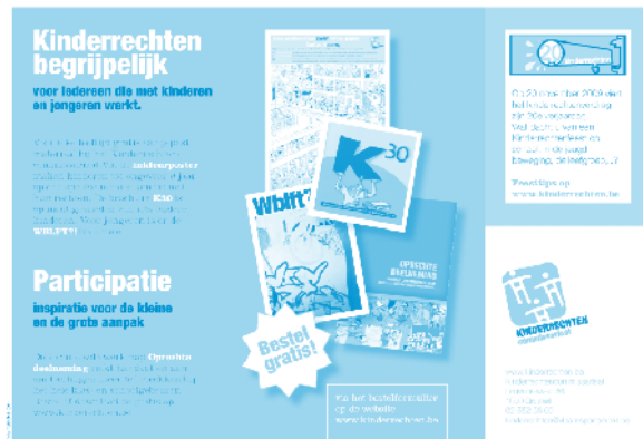
Advertentie Jeugd en Vrede 2009

Het Kinderrechtencommissariaat adverteerde over zijn publicaties in Yeti en Maks!, de Klasse- onderwijsbladen voor kinderen en jongeren, in Klasse voor Leraren en in de catalogus van Jeugd en Vrede. Soms verschijnt er een advertentie naar aanleiding van een bepaald evenement, zoals de festiviteiten rond 20 jaar kinderrechten en de Jeugdboekenweek.