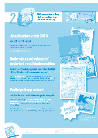
Advertentie Klasse voor leraren februari 2010