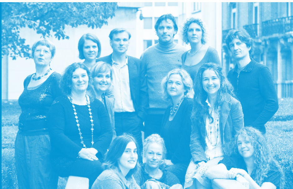
De medewerkers van het Kinderrechtencommissariaat