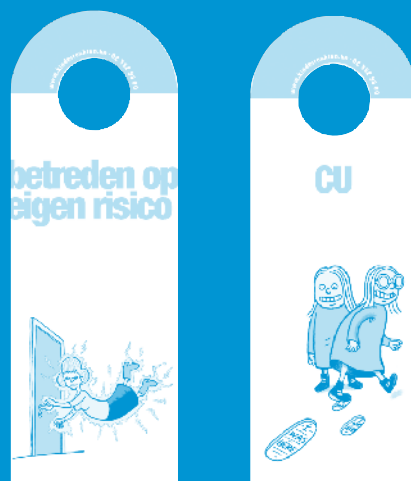
De deurhanger maakt de ombudsdienst van het Kinderrechtencommissariaat bekend naar kinderen en jongeren.

Ook het stickervel met cartoons en contactgegevens van de ombudsdienst van het Kinderrechtencommissariaat is een blijver. Ruim 22.400 exemplaren werden opgevraagd via de websites of uitgedeeld op events. 185.000 exemplaren werden verspreid via het departement Onderwijs, het Agentschap Sociaal-Cultureel Werk voor Jeugd en Volwassenen-Afdeling Jeugd, de Afdeling Welzijn en Samenleving, het Agentschap Zorg en Gezondheid, het Agentschap Jongerenwelzijn, het Agentschap voor Personen met een handicap, en Kind & Gezin.